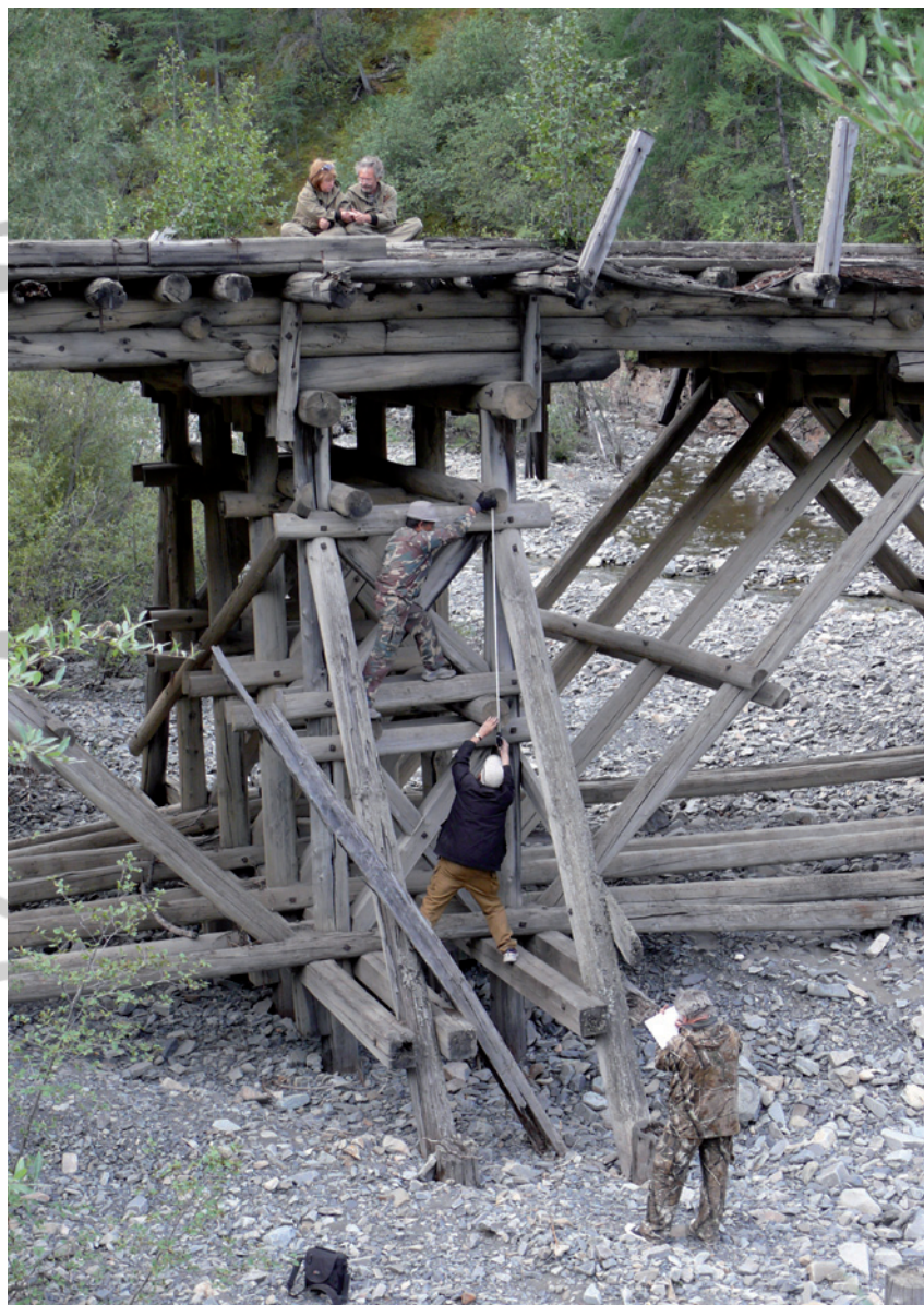
Обмеры моста на Колымской трассе

перь строители сооружают новую дорогу, которая часто проходит по этим памятным местам. Огромные мощные бульдозеры сметают на своём пути все остатки прежних строений, в том числе и уникальных по своей конструкции деревянных мостов.