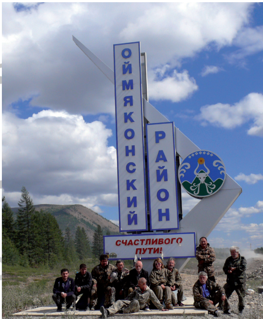
Члены экспедиции у знака на границе Оймьяконского и Томпонского улусов

завезено почти 750 тысяч человек, и почти пятая часть из них остались лежать в якутской земле (умерли от тяжелейших условий или были расстреляны).