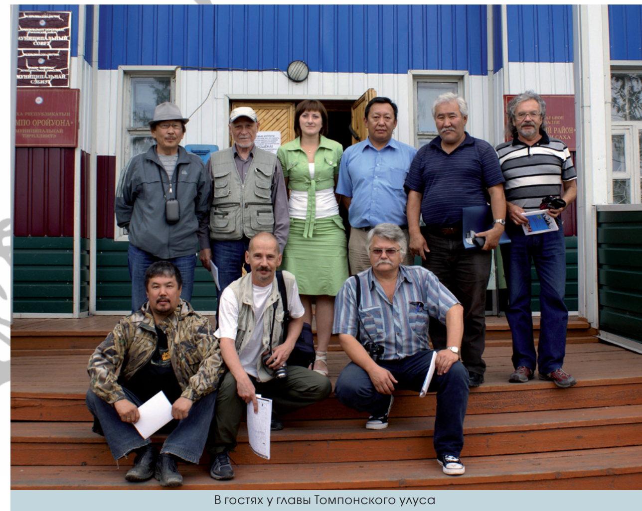
В гостях у главы Томпонского улуса

Употребляя термин «сталинские репрессии», мы часто забываем, что ещё вождь мирового пролетариата, начиная сразу же после свершения Октябрьской революции, провозгласил террор относительно всех инакомыслящих. Можно кратко назвать первые послереволюционные документы и решения по этой проблеме. Уже в декабре 1917-го Наркоматом юстиции была принята инструкция, определяющая состав Революционного трибунала, в мае 1918 года — декрет