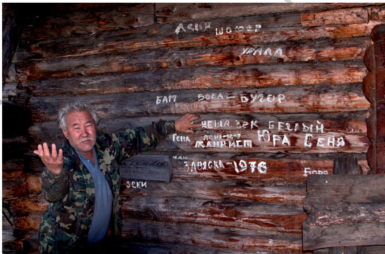
У стены лагерной казармы