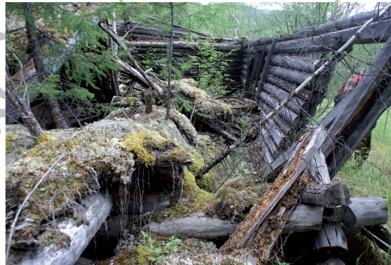
Развалины лагерной постройки

Примечательно, что чаще всего началом репрессий становились те или иные постановления партии и правительства. Так, например, постановление Политбюро ЦК ВКП (б) «О положении в Якутской организации» от 9 августа 1928 года вызвало мощную волну репрессий в Якутии. Спустя год после этого появился циркуляр ОГПУ о создании троек для предварительного рассмотрения законченных следственных дел. Именно эти тройки чаще всего и решали судьбу подсудимых без всякой волокиты и судов. С 1930 года они, согласно приказу ОГПУ СССР, стали создаваться практически по всей стране – во всех краях и областях советского государства. В ноябре 1934 года постановлением ЦИК и СНК СССР было учреждено так называемое Особое Совещание (ОСО) при НКВД, действовавшее почти 20 лет. За эти годы